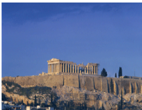
Atene - Il Partenone

La seconda giornata ha compreso quattro sessioni- panel legate al tema delle innovazioni nel finanziamento del commercio internazionale.