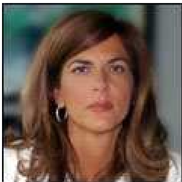
Emma Marcegaglia, nuovo Presidente di Confindustria

I leader delle organizzazioni più rappresentative di imprese dei Paesi partecipanti al G8, tra cui Confindustria, riuniti a Tokyo il 17 aprile 2008, hanno pubblicato una Dichiarazione congiunta in vista del Summit del G8 in programma dal 7 al 9 luglio a Hokkaido, Giappone. Nella Dichiarazione viene richiamata l'attenzione dei Capi di Stato e di Governo degli otto Paesi su tre problematiche prioritarie: il rafforzamento delle istituzioni finanziarie private, il monitoraggio del mercato dei cambi e l'abbattimento delle barriere al commercio e