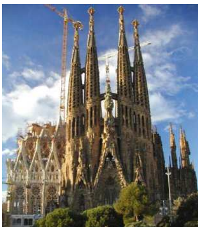
Barcellona – La Sagrada Família

Il 27-29 giugno 2008 la ICC organizza a Barcellona un weekend in cui si svolgerà un Forum per giovani arbitri a cui parteciperanno avvocati e consulenti legali al di sotto dei 40 anni che lavorano nel campo dell'arbitrato internazionale.