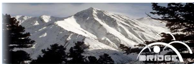
Martiros Saryan – Il monte Ararat

Giunto alla settima edizione, il forum economico internazionale "BRIDGE", il più importante evento economico annuale della Repubblica di Armenia, ha assunto la caratteristica di un appuntamento ormai consolidato. Anche