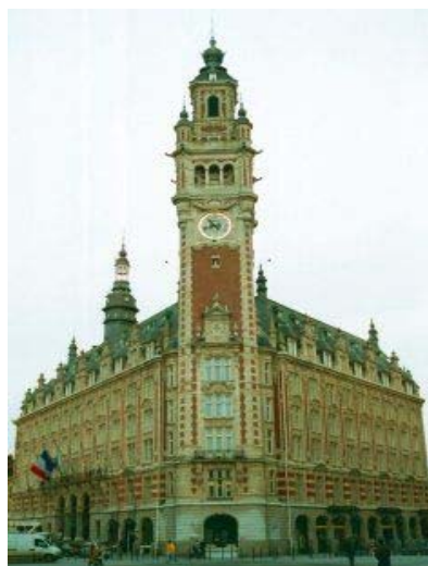
La Camera di Commercio di Lille

“ The market place for best practices ” è il tema della seconda edizione di CCIPro, iniziativa del Consorzio delle Camere di commercio francesi, che si terrà a Lille dal 29 al 30 giugno. La prima edizione di CCIPro si è tenuta nel 2004 riscuotendo grande successo come vetrina delle camere di commercio francesi, presentando in particolare le best practices delle camere di diritto pubblico in una vasta gamma di attività e servizi. L'evento avrà grande rilevanza in questa seconda edizione, in quanto aperta a livello europeo anche con un programma speciale per Camere non francesi e presentando anche Camere dell'Africa francofona.