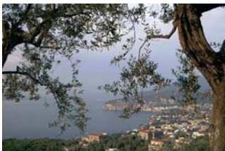
Veduta di Sorrento

"STYLE AND SUBSTANCE": L'INDUSTRIA NAVALE ITALIANA PROTAGONISTA DEL "MARE FORUM" 2006