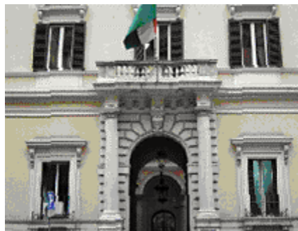
Sede ICC Italia - Roma