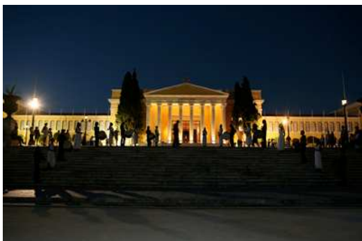
Zappeion Palace – Atene

L'edizione 2008 del "Global Forum - Shaping the future" si terrà ad Atene il 21 e 22 ottobre 2008.