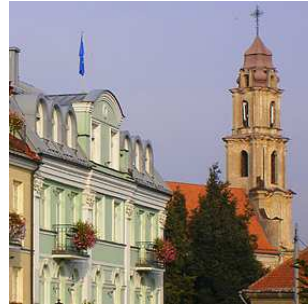
uno scorcio di Vilnius

" Managing Risks in International Business Using Blended Trade Finance Solutions " è il titolo di un seminario pratico della durata di due giorni (Vilnius, 2-3 ottobre) organizzato da ICC Lituania.